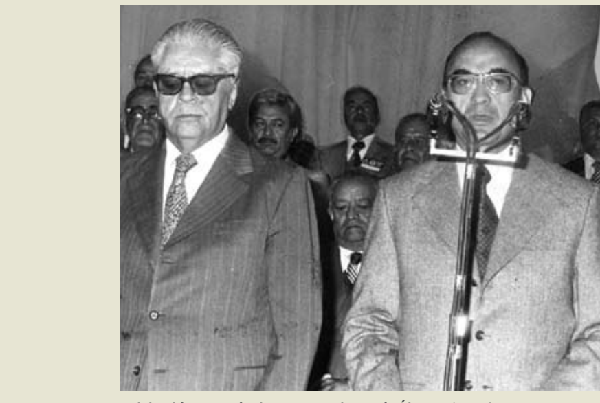
Fidel Velázquez Sánchez y Luis Echeverría Álvarez (1976).