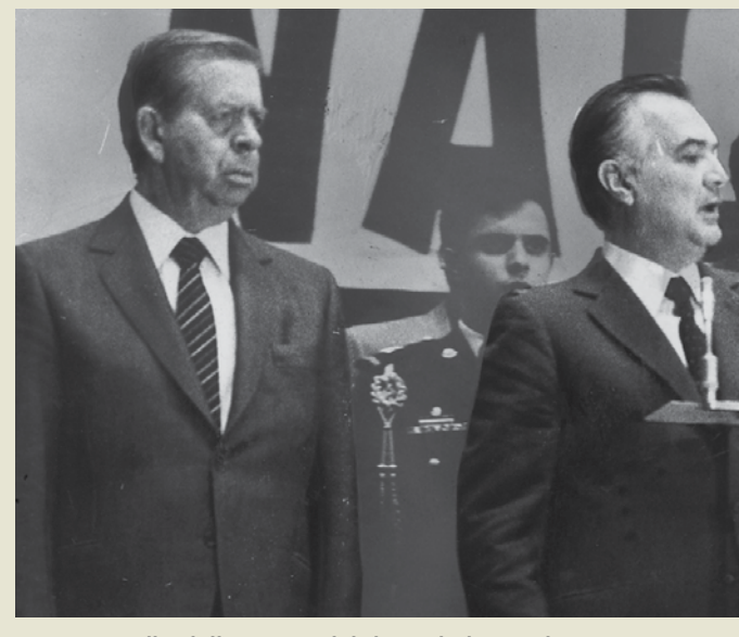
Arsenio Farell Cubillas y Miguel de la Madrid Hurtado.