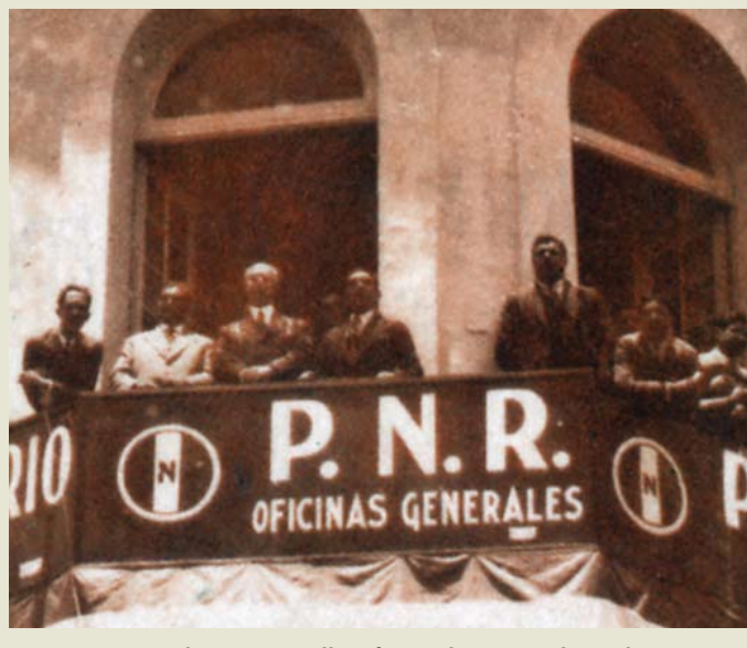
De 1929 a 1938 el instituto se llamó Partido Nacional Revolucionario.

Cada año, los presidentes en turno desfilaban ante los tres sectores del partido, en una ceremonia que quiere recuperar ahora el esplendor.