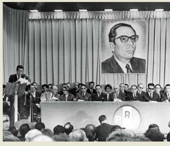
El CEN del Revolucionario Institucional con Gustavo Díaz Ordaz.